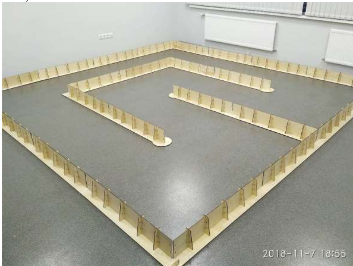
Рис.1. Игровое поле Robogase

2.1. Игровое поле является поверхностью, ограниченной бортами (Рис.1).