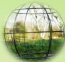
Шар (опора для вьющих растений)