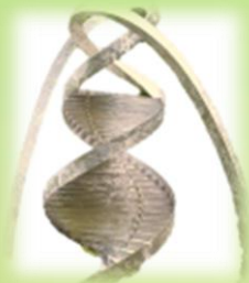
Шпалер для вьющих растений