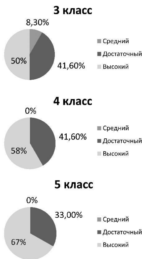
Диаграмма 2. Уровень обученности учащихся

У пятиклассников отмечается достаточный и высокий уровни владения учебным предметом. То есть 66,6 % учащихся умеют построить высказывание логично и связно, выражают свое отношение