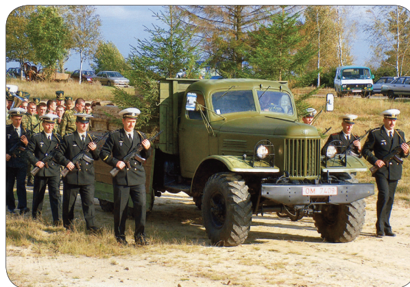
Перазахаванне астанкаў байцоў з воінскімі ўшанаваннямі