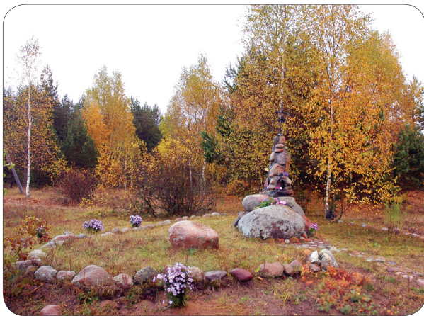
Помнік на месцы баёў рускіх салдат

гад спыніць работы і сустрэўся з Цітовічам у Заброддзі. Яны разам пачалі даведвацца ў мясцовых жыхароў, што гэта за могільнік у ляску. Тады ў жывых былі непасрэдняыя сведкі падзей 1916-1917 гадоў паблізу вёскі Заброддзе. Мясцовыя і расказалі, што ў 1916 годзе ў гэтым ляску знаходзіўся паходны лазарэт рускіх войск, і памерлых ад ран салдат і афіцэраў хавалі на тым жа месцы. У аднаго з жыхароў знайшлася і фатаграфія 1916 года з салдатамі, санітаркамі і дакторкай гэтага лазарэта.