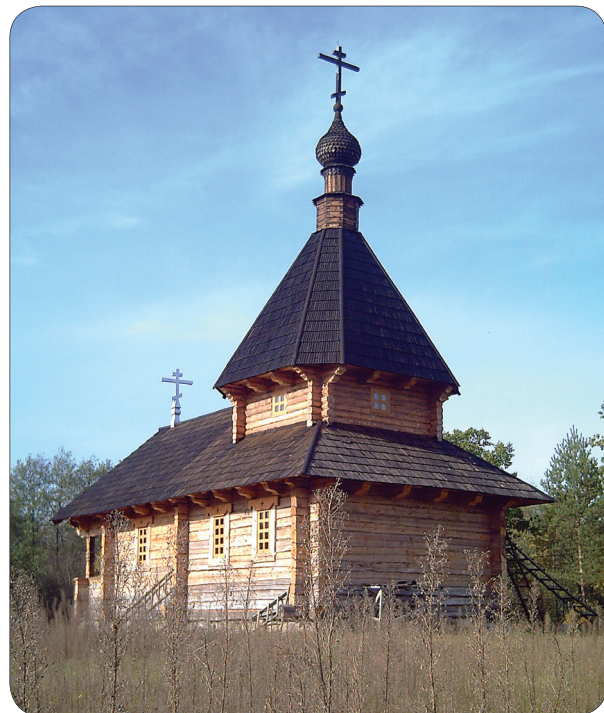
Часоўня князёў Барыса і Глеба