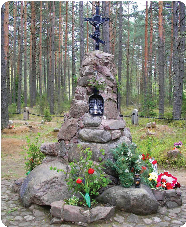
Месца лазарэта і могільнік пахаваных салдат і афіцэраў 2-ой Рускай арміі

і пры пастаянным удзеле у гэтай справе вучняў нашай школы цяжкая і крпатлівая, сумесная работа прынесла свой плён.