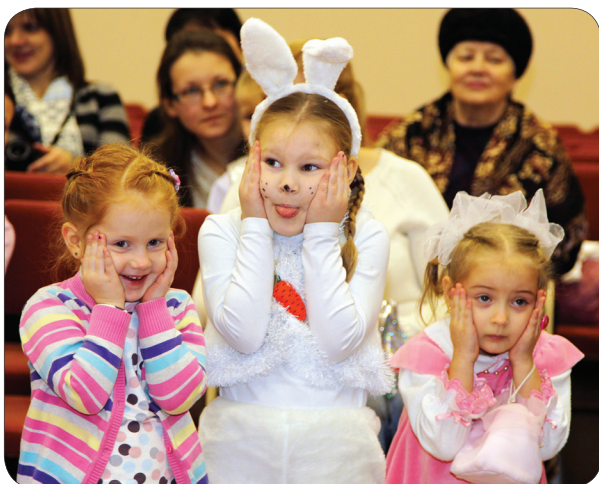
Театрализованное представление в «Калейдоскопе»