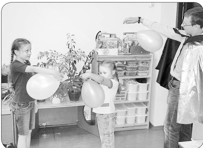
Фокусник раскрывает секреты

ния могут варьироваться в зависимости от запросов родителей: «Что такое эксперимент?», «Правила безопасности во время проведения опытов и экспериментов» и др.